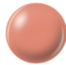
81732 PEACHY KEEN creme