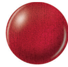
81674-81635 RED PEARL nacarado