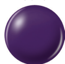
83847 PUR-PLE creme