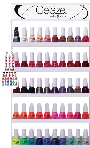
SALON RACK (VACÍO) 82663