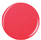
82255-82235 SURFIN' FOR BOYS neón