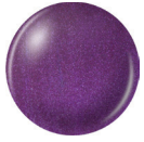
81660-81621 COCONUT KISS nacarado