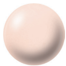
81652-81613 INNOCENCE creme