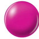
81683-81644 PURPLE PANIC neón