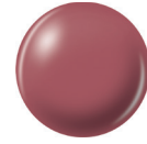
81668-81629 FIFTH AVENUE creme