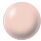
81730 DIVA BRIDE creme