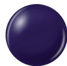
82261-82241 UP ALL NIGHT creme