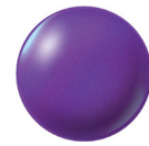
81724-81813 FLYING DRAGON glitter