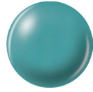
81664-81625 FOR AUDREY creme