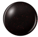
81731 LUBU HEELS glitter