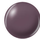
81658-81619 BELOW DECK creme