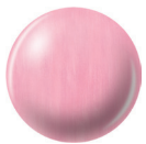
81651-81612 EXCEPTIONALLY GIFTED nacarado