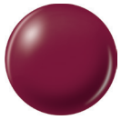
81670-81631 SEDUCE ME creme