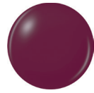
81673-81634 LONG KISS nacarado