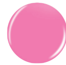
82243-82223 DANCE BABY creme