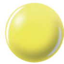
81721-81809 CELTIC SUN neón