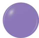
82259 THAT'S SHORE BRIGHT creme