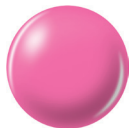
81685-81646 SHOCKING PINK creme