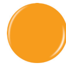
82254-82234 SUN WORSHIPER neón