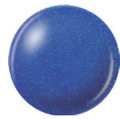
81720-81812 FROSTBITE nacarado