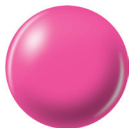
81684-81645 PINK VOLTAGE neón