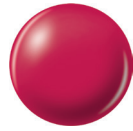
81679-81640 MAKE AN ENTRANCE creme