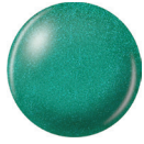
81663-81624 TURNED UP TURQUOISE nacarado