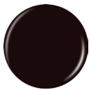
82245-82225 EVENING SEDUCTION creme