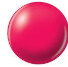
81682-81643 POOL PARTY neón