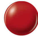
81675-81636 SALSA creme