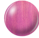
81669-81630 AWAKENING nacarado