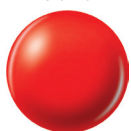
83639 RED-Y TO RAVE creme