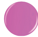
82242-82222 BOTTOMS UP creme