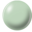
81665-81626 RE-FRESH MINT creme