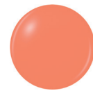
82253 SUN OF A PEACH creme