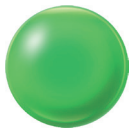
81727-81815 IN THE LIME LIGHT neón