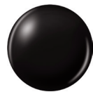
81654-81615 LIQUID LEATHER creme