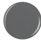
82251-82231 RECYCLE creme