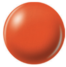
81671-81632 CORAL STAR nacarado