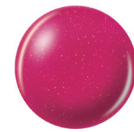
81723-81810 STRAWBERRY FIELDS nacarado