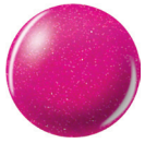
81677-81638 AHOY! nacarado