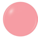
82250 NEON & ON & ON neón