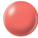
81681-81642 FLIP FLOP FANTASY neón