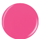
82264-82267 THISTLE DO NICELY neón