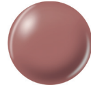
81667-81628 DRESS ME UP creme