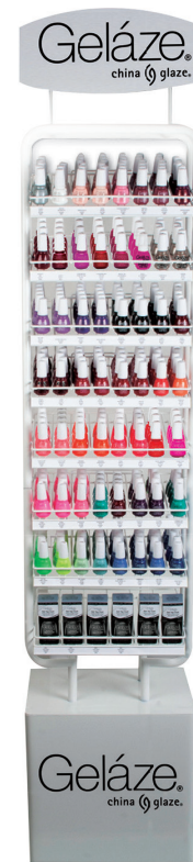
EXPOSITOR DE PIE (VACÍO) 82174

576 UNIDADES Capacidad máxima 576 unidades (64 tonos/básicos x 9 unidades).