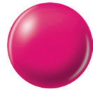
81680-81641 RICH & FAMOUS creme