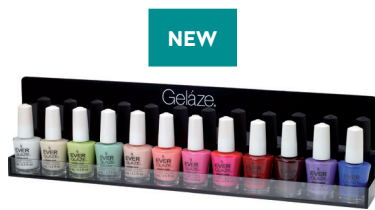
DISPLAY DE PARED (VACÍO) 83457