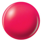
81728-81816 ROSE AMONG THORNS neón