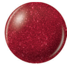
81672-81633 RUBY PUMPS glitter