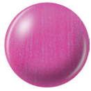
81678-81639 CARIBBEAN TEMPTATION nacarado