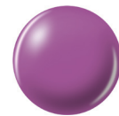
81659-81620 SPONTANEOUS creme