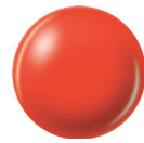
81722-81820 ORANGE KNOCKOUT neón