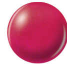
81676-81637 SEXY SILHOUETTE nacarado