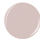
82263-82266 DONT HONK YOUR THORN creme