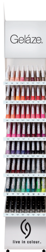
RACK LED (VACÍO) 81598

576 UNIDADES Capacidad máxima 576 unidades (64 tonos/básicos x 9 unidades).