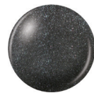
81655-81616 BLACK DIAMOND nacarado