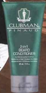
2-in-1 beard conditioner