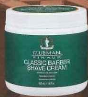
classic barber shave cream