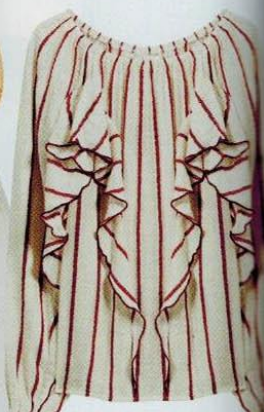
Blusa en algodón, con volantes y estampado de rayas, de Intropia, 155 €; 913 993 112.