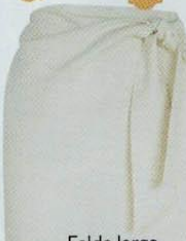
Falda larga en algodón, tipo pareo, de Massimo Dutti; 937 667 699.