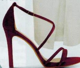
Sandalia en ante, de Lodi, 109 €; 966 981 298.