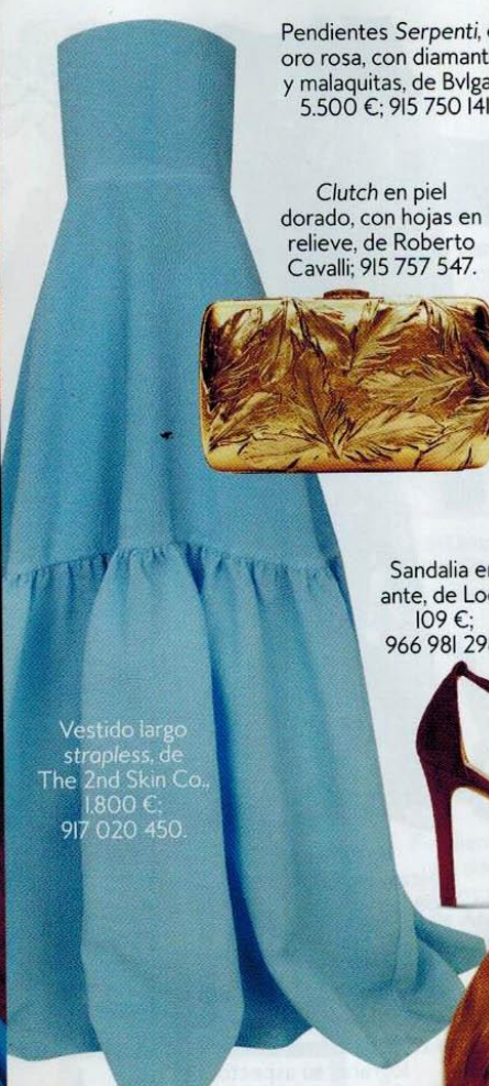
Vestido largo strapless, de The 2nd Skin Co., 1.800 €; 917 020 450.