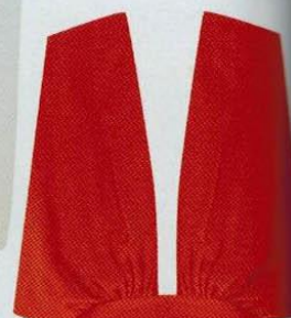
Vestido largo, con maxiescote, de Uterqüe, 150 €; (uterque.com).